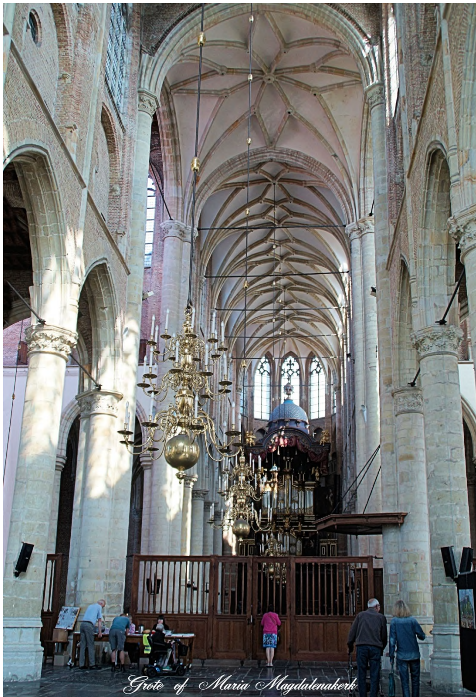
Grote of Maria Magdalenakerk