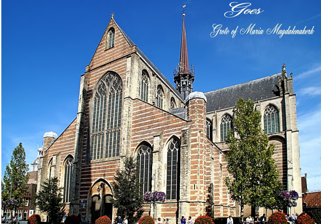
Goes Grote of Maria Magdalenakerk

Het Lemster Mannenkoor stond onder leiding van dirigent