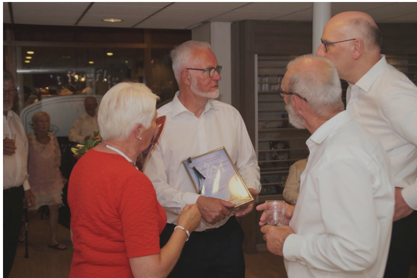
Noch wat plaatsjes fan de tredde helte.....