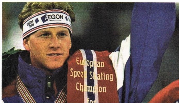
De beer van Lemmer