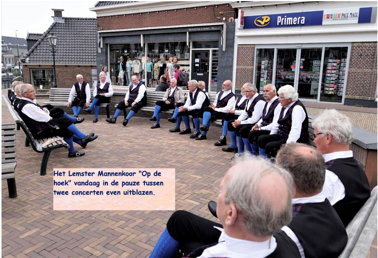
Het Lemster Mannenkoor "Op de hoek" vandaag in de pauze tussen twee concerten even uitblazen.