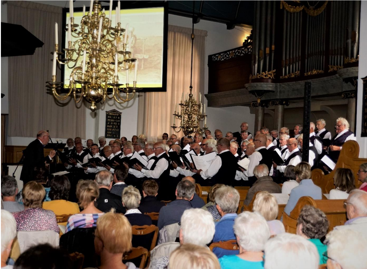
Het Lemster Mannenkoor zingt in Frysk Kostuum.