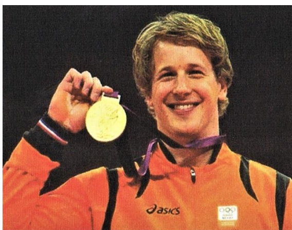
De leeuw van Lemmer