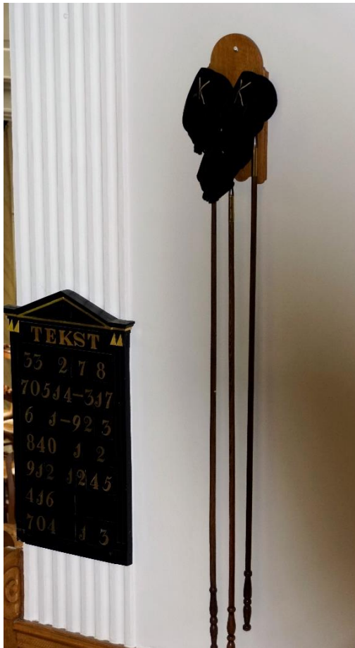
Ponkjes in ruste...