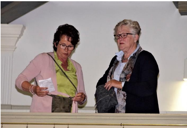
Dat programma lezen we thuis nog....