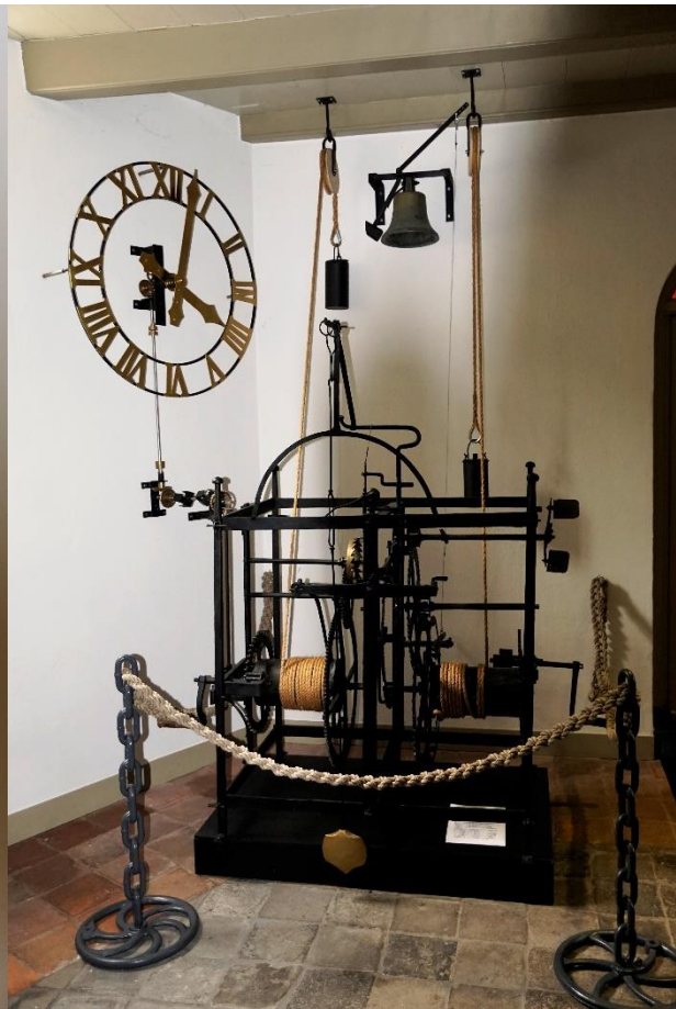
Oude uurwerk Lemster Toer