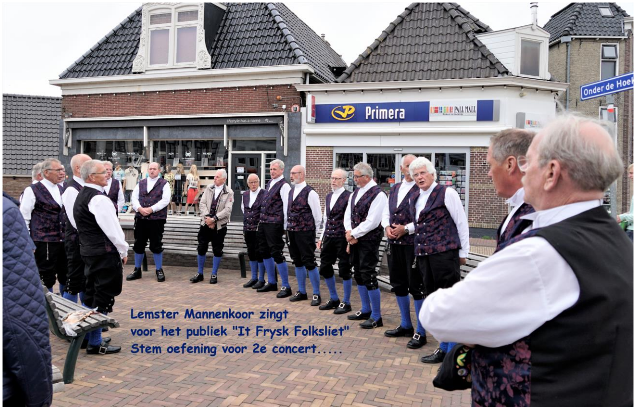
Lemster Mannenkoor zingt voor het publiek "It Frysk Folksliet" Stem oefening voor 2e concert.....