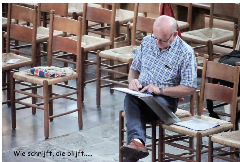
Wie schrijft, die blijft.....