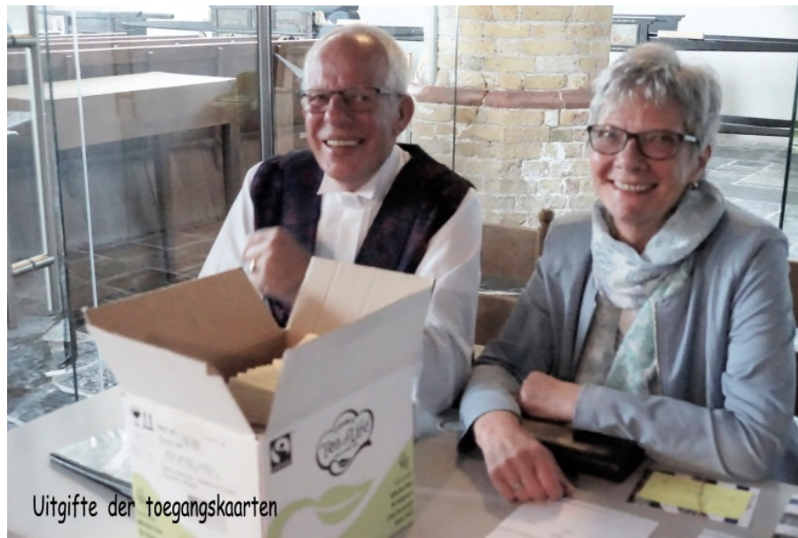
Uitgifte der toegangskarten