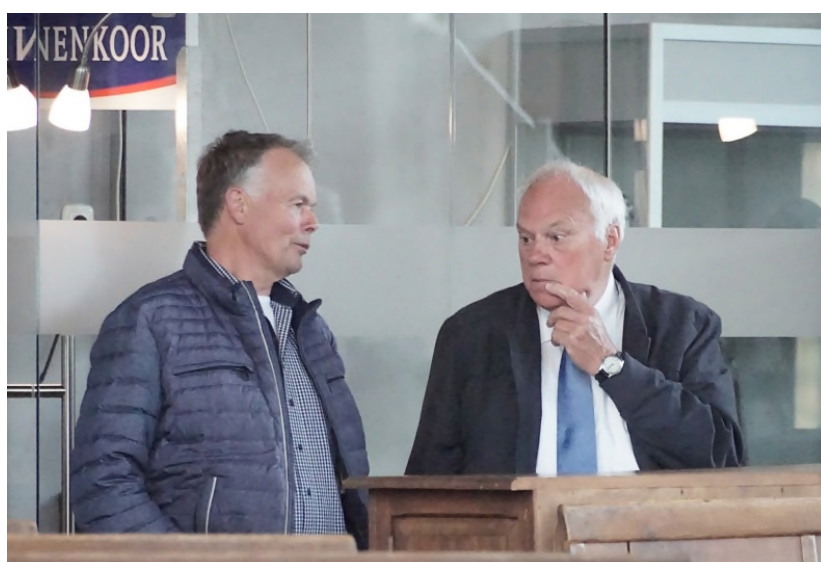
De kosters van de kerk