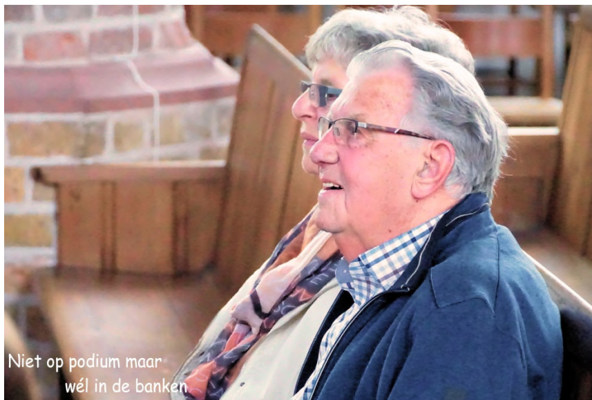
Niet op podium maar wél in de banken