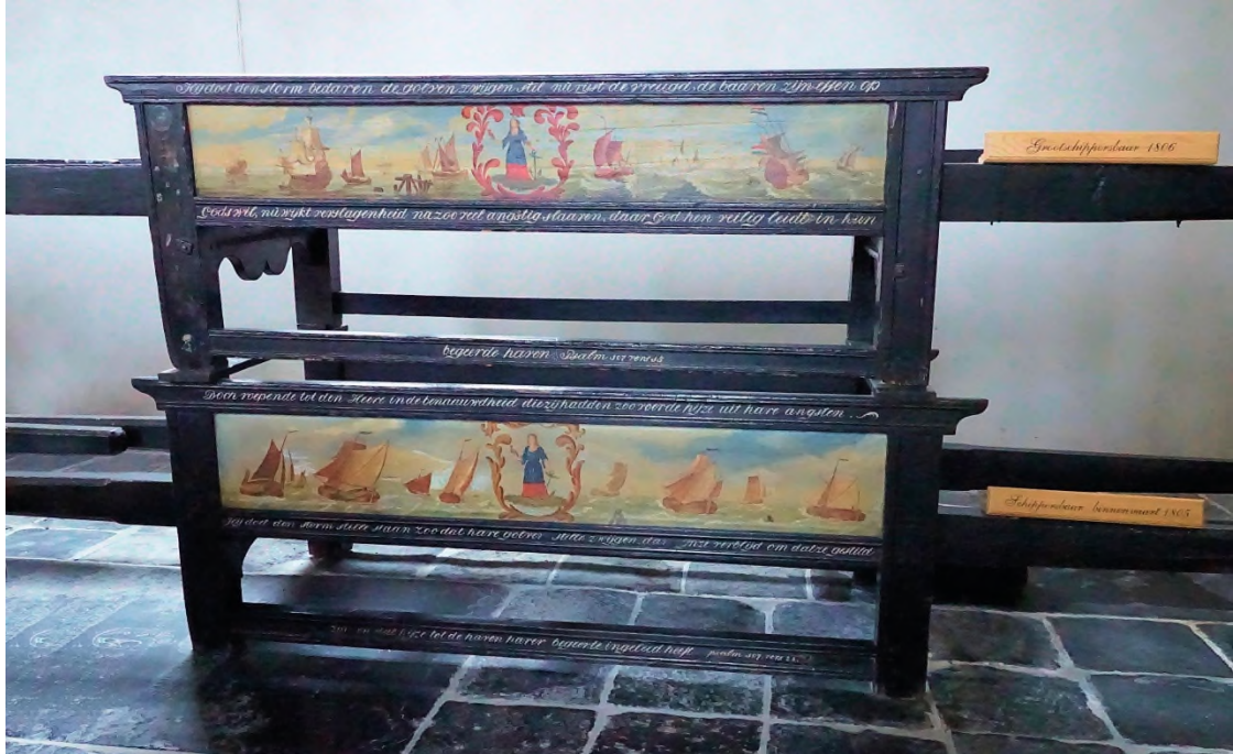
De verschillende beroepsgroepen (gildes) hadden vroeger elk hun eigen baar voor de begrafenis van overledenen