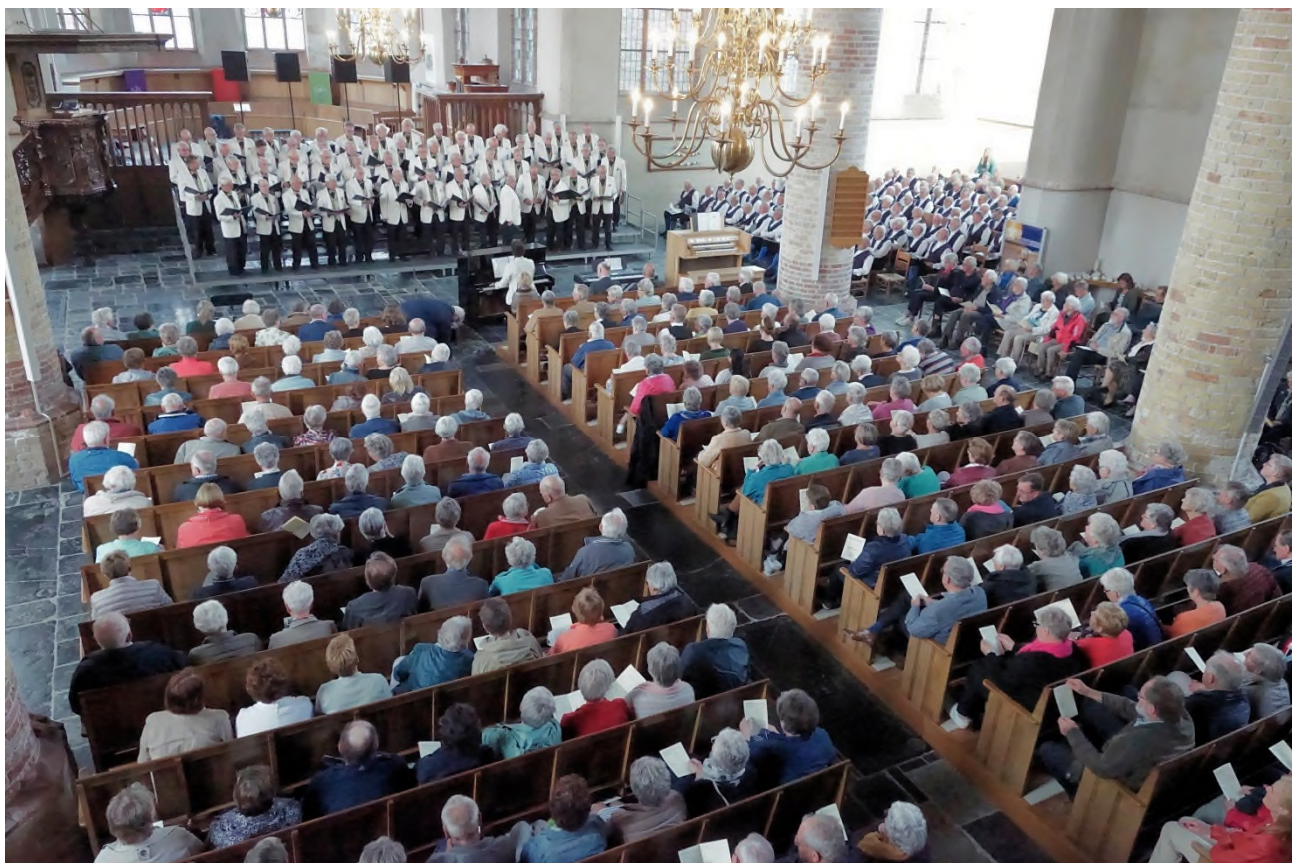
Een vrijwel volle kerk