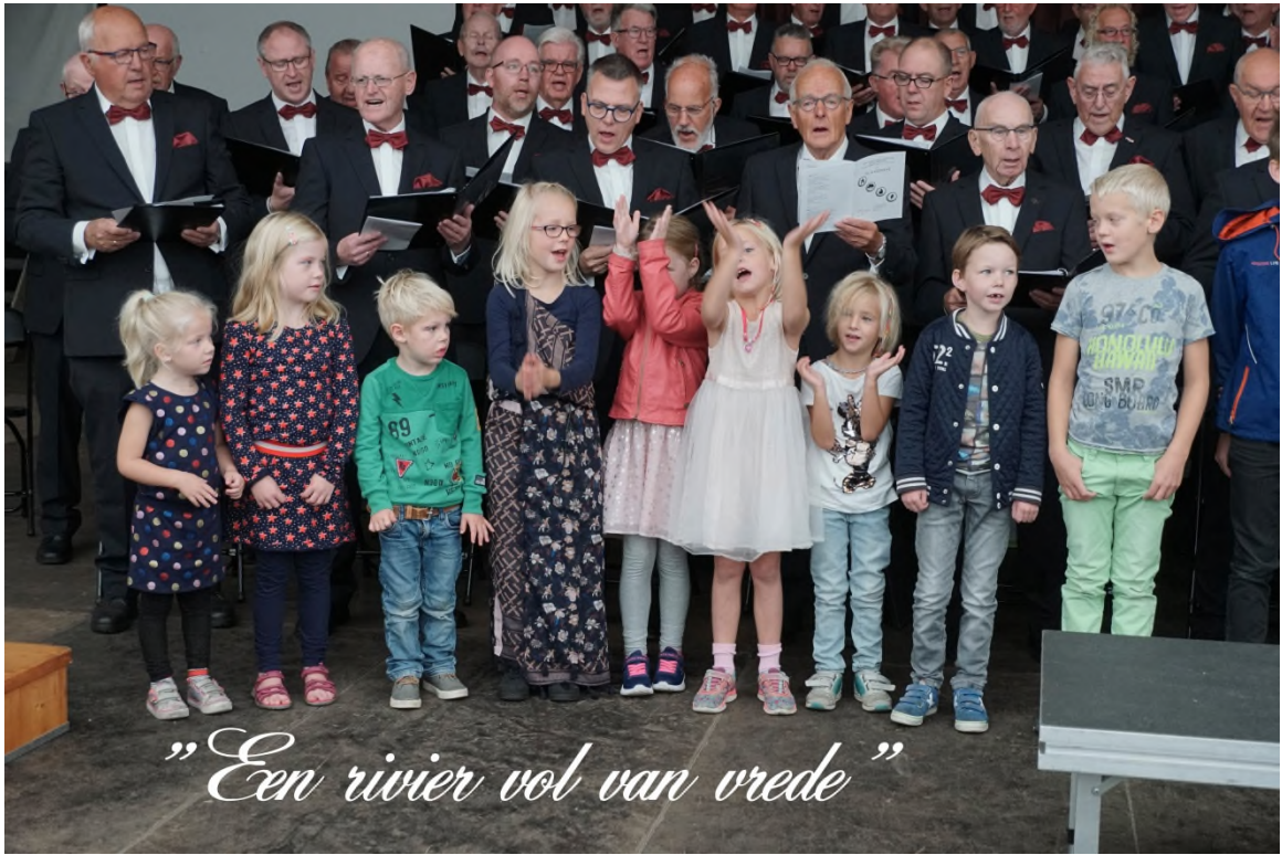
"Een rivier vol van vrede"