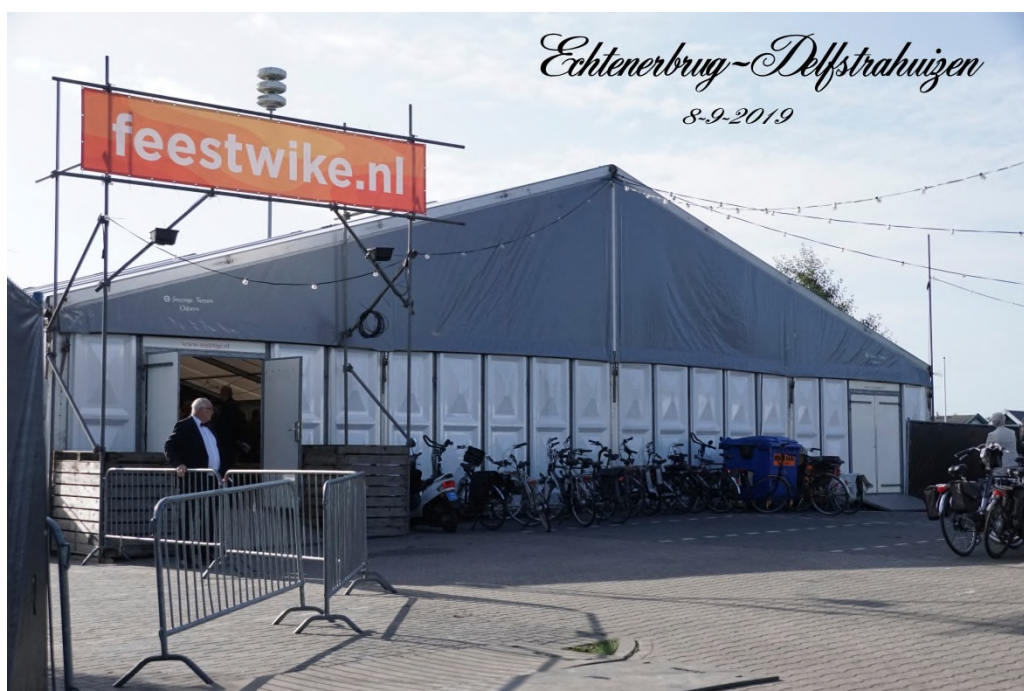
De feesttent op de nieuwe locatie