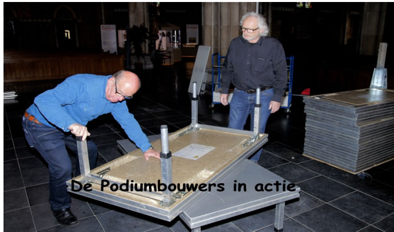
De Podiumbouwers in actie