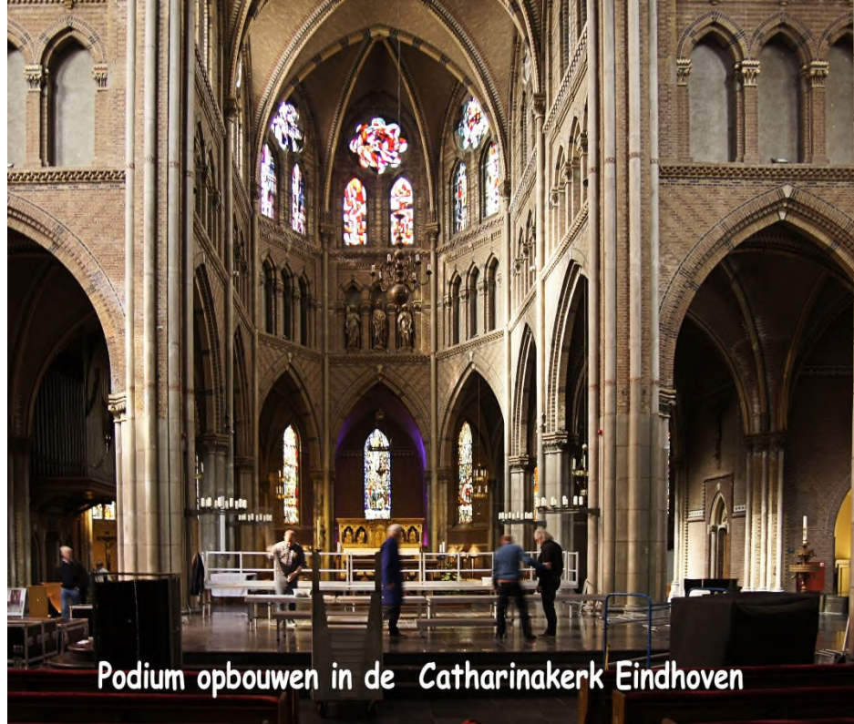
Podium opbouwen in de Catharinakerk Eindhoven