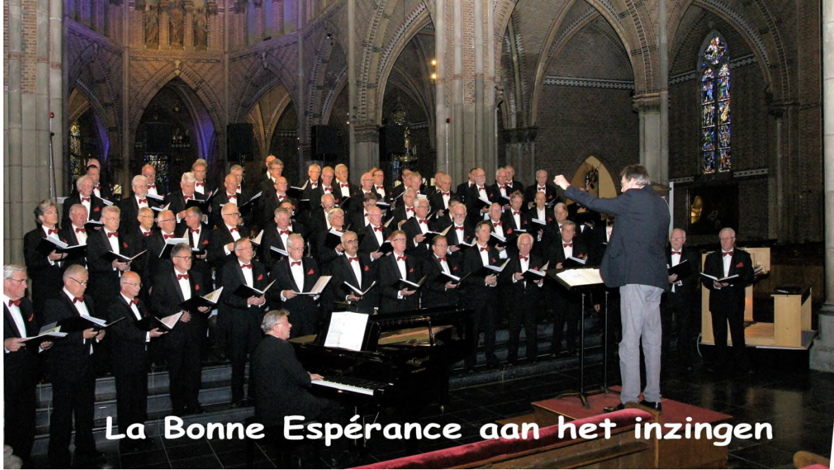
La Bonne Espérance aan het inzingen