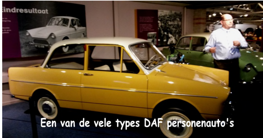
Een van de vele types DAF personenauto's