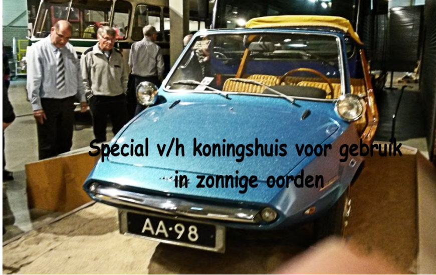
Special v/h koningshuis voor gebruik in zonnige oorden