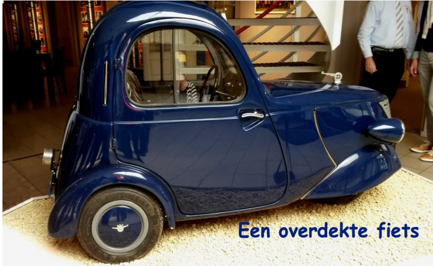
Een overdekte fiets