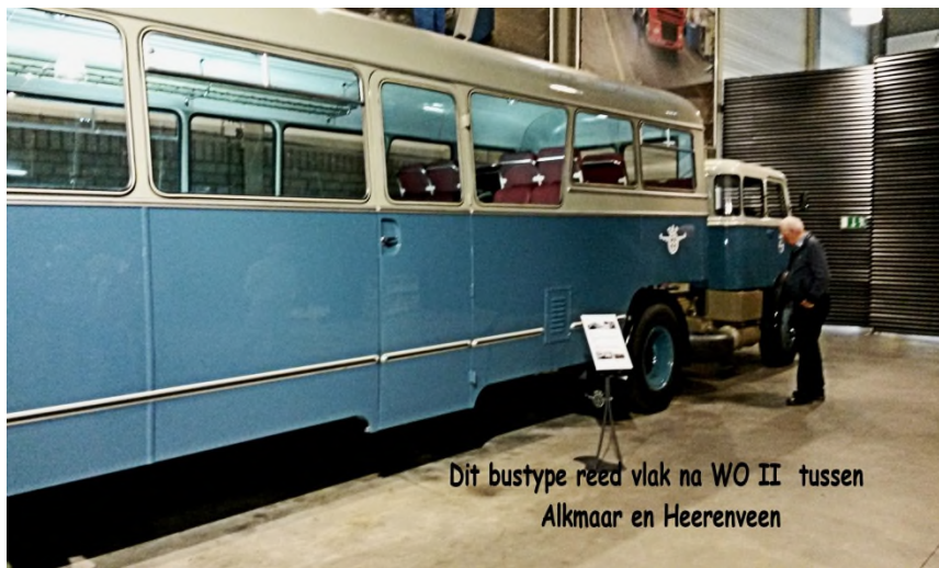
Dit bustype reed vlak na WO II tussen Alkmaar en Heerenveen