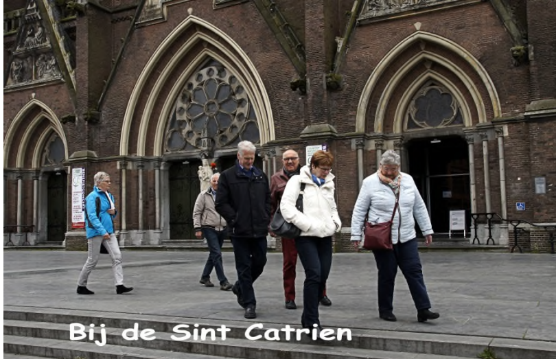
Bij de Sint Catrien