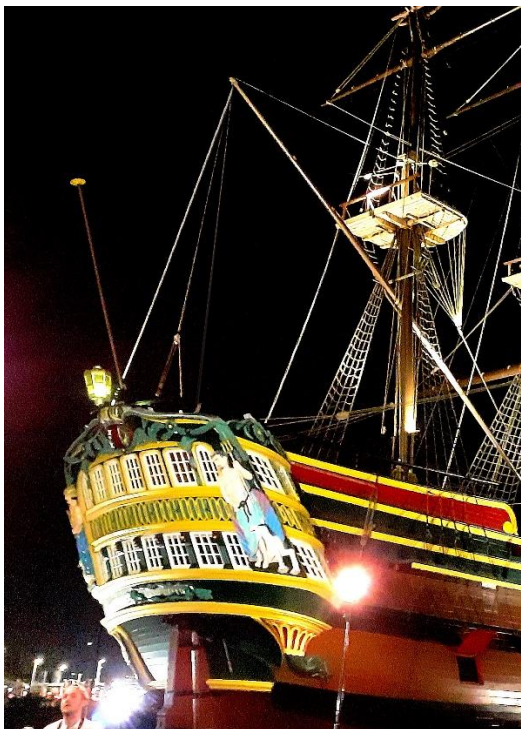
VOC schip "Amsterdam" op haar maiden trip gestrand op de kust van Zuid-Engeland